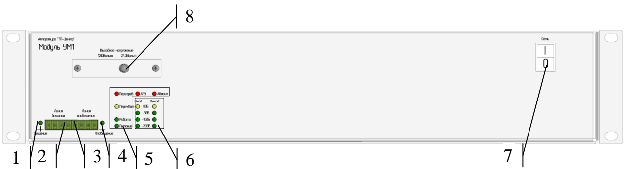
Рисунок 3 – Элементы передней панели УМ1 с выходным напряжением 120/240В