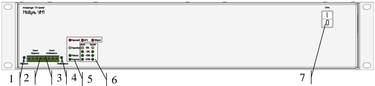
Рисунок 2 – Элементы передней панели УМ1 с выходным напряжением 100В

УМ1 выполнен в виде блока в конструктиве Евромеханика 19” высотой 2U. Элементы индикации и коммутации передней панели УМ1 представлены на рисунке 2 и 3.