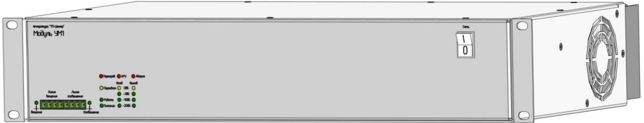
Рисунок 1 – Усилительный модуль УМ1-100/xxx

Внешний вид УМ1 представлен на рисунке 1.